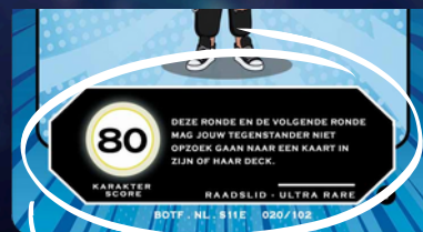
BRAWL - OOK MET EFFECTEN